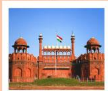
♥♦♦ Agra Fort