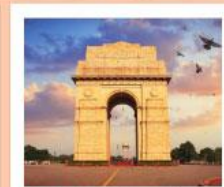
♥♦♦ India Gate