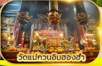
วัดแม่กวนอิมสองฮ่า