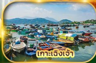
เกาะเจิงเจ้า