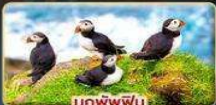
นกพิฟฟิน

📅 เดินทาง : 30 เม.ย. - 07 พ.ค. | 23-30 ก.ค. 69