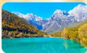
ทะเลสาบโป้สุยเทอ