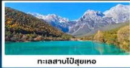
ทะเลสาบโป๋สยเหอ