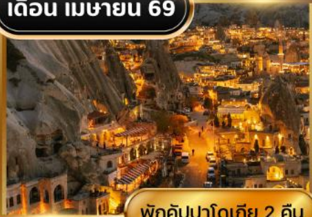
พักคัสปาดอกีย์ 2 คืน