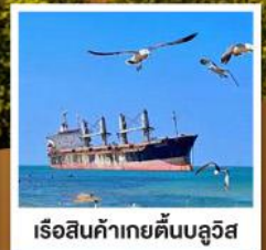
เรือสินค้าเกย์ตันบลูวิส