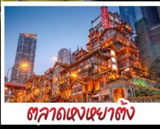
ตลาดแดงเซาตัง