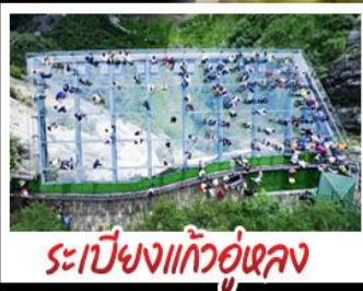
ระเบียงแก้วอุโมงค์