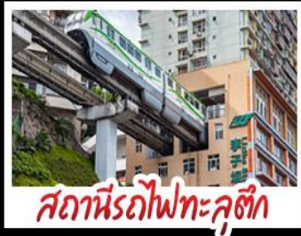
สถานีรถไฟทะลุคอก

ฉงชิ่ง - อุโมงค์ - หงหยาดัง - อุทยานเขานางฟ้าฉงชิ่ง สถานีรถไฟทะลุคอก - หลุมฟ้าสามสะพานสวรรค์