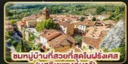
ชมหมู่บ้านที่สวยงามที่สุดในฝรั่งเศส (มูสติเยแซงก์มาร์)