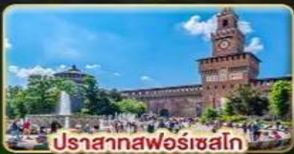
ปราสาทฟอโรเซโก

📅 เดินทาง : 28 พ.ค. - 06 มิ.ย. | 05-14 ส.ค. 15-24 ต.ค. 69