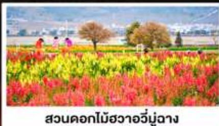
สวนดอกไม้ฮวงอวี่มู่ฉาง