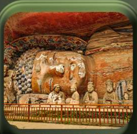
“ พาทินแคะสลักต้าจู้ ”

T2G-CKG26CZ Special of Chongqing...จงซิ่ง ต้าจู้ อุ้หลง อุทยานหลุมฟ้า เขานางฟ้า 5D 3N (CZ)