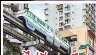
รถไฟฟ้าทะเลตุ๊ก