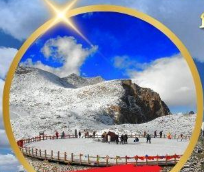
OPTIONAL TOUR ธารน้ำแข็งต่ากู่ปิงชวน