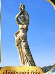
จูไห่ฟิชเชอร์เก็ส