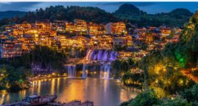
หมู่บ้านโบราณฝูหรงเจิน