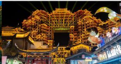
ตีทมห้ศจสรย์ 72