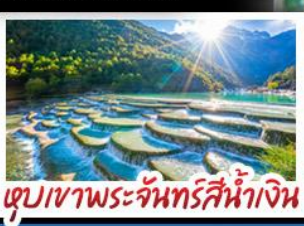
ตูปเขาพระจันทร์สีน้ำเงิน