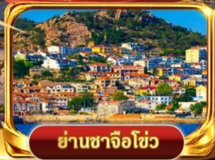
ย่านซาจื่อไห่