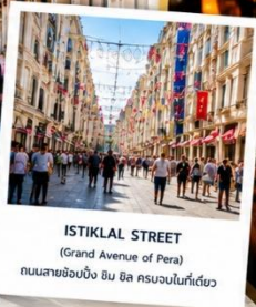
ISTIKLAL STREET (Grand Avenue of Pera) ถนนสายช้อปปิ้ง อิม บิล ครอบคลุมในที่เดียว