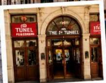
สถานีทูนเนล (TUNEL STATION) สถานีรถไฟใต้ดินสายเก่าแก่ และเป็นหนึ่งในระบบขนส่งที่เก่าแก่ที่สุดในโลก