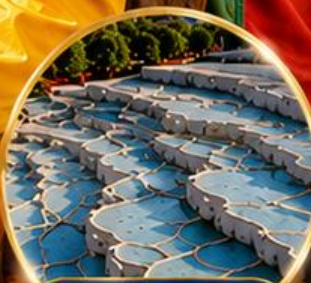
ปามุกคาล่า Pamukkale