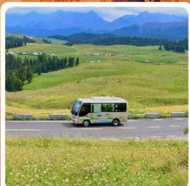
ทุ่งหญ้าเจียบจูลาเค่อ