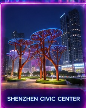
SHENZHEN CIVIC CENTER