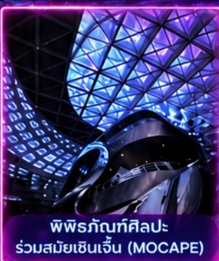
พิพิธภัณฑ์ศิลปะ ร่วมสมัยเซินเจิ้น (MOCAPE)