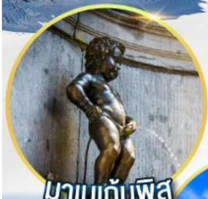
มานกันพิส