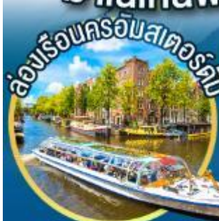
ลองเรือครอัสเตอร์คัม