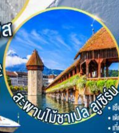
สะพานไม้อาเปลา ลูเซิร์น