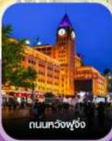
ถนนทวิงฟู่จิ่ง