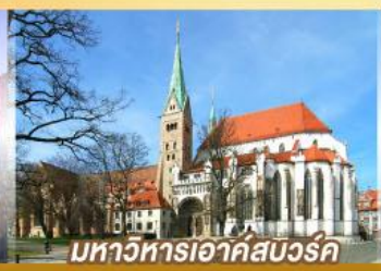
มหาวิหารเอาก์สเวิร์ค