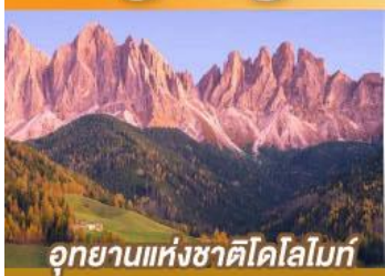
อุทยานแห่งชาติโดโลไมท์

ขึ้นเครื่องบินตรงนครอัมสเตอร์ดัม กับเส้นทางสายโรแมนติก พร้อมการแสดงพื้นบ้านสไตล์ที่โรเลียนสุดพิเศษ