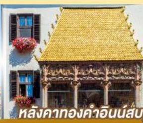
หลังคาทองคำอินน์ส์บรุค