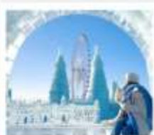
ICE & SNOW FEST.