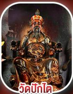
วัดปึกไต่