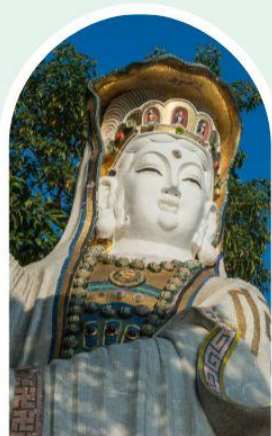
เจ้าแม่กวนอิม ธิพลสัย