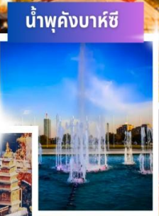
น้ำพุคิงบาร์ชี