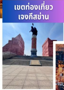
เขตท่องเที่ยว เจงกิสข่าน