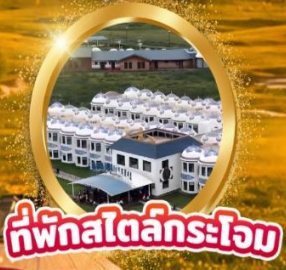
ที่พักสไตล์กระโจม