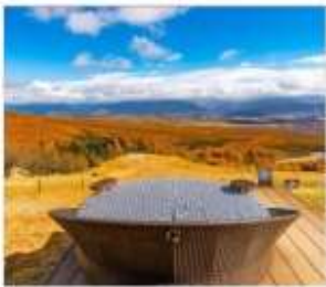
ดิโยซาโตะเทอเรส