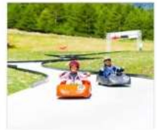
กิจกรรมขับโกคาร์ท