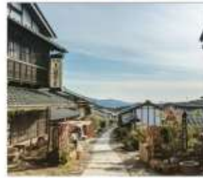
มาโกะเมะจุกุ