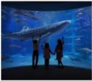
พิพิธภัณฑ์สัตว์น้ำโดยดั่ง