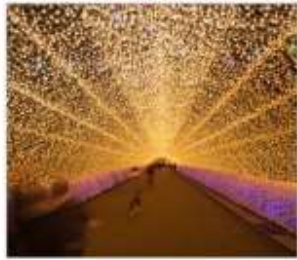
นาบะนะโนะซาโตะ