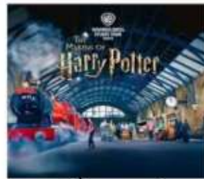
แฮร์รี่ พอตเตอร์ สตูดิโอโตเกียว