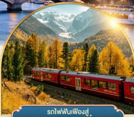
รถไฟฟันเฟืองสู่ ยอดเขากรอนเนอส์เกรต