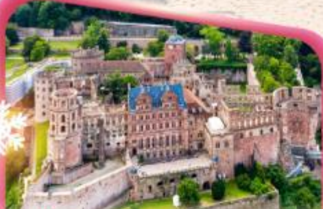
ปราสาทไชเตลมเบิร์ก