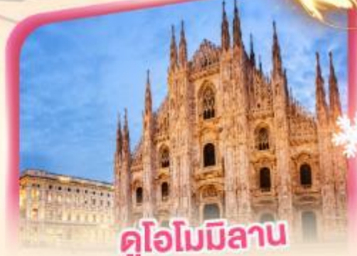
คูโอโมมิลาโน