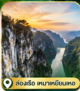
ล่องเรือ เขมาเหยียนเหอ