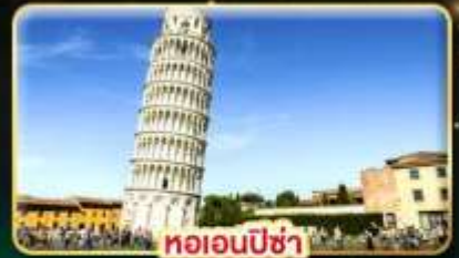
หออนพีซ่า