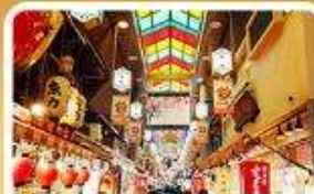
ตลาดปลาฮิชิ