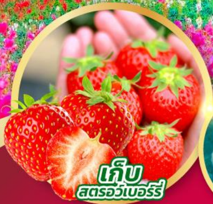
เก็บ สตอร์วเบอร์รี่