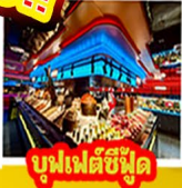
บุฟเฟต์ซีฟู้ด