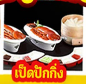
เปิดปีกกึ่ง