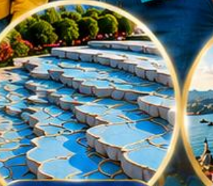
ปานุกคาล์ Pamukkale