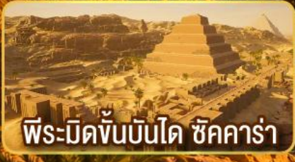
พีระมิดขั้นบันได ชัคคาร์่า