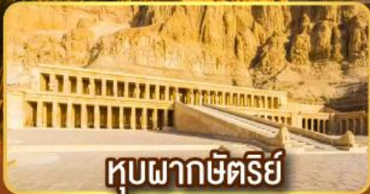
หุบผากษัตริย์