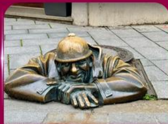
เซลฟี่คู่คูมิล บราติสลาวา