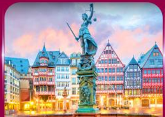
จัตุรัสโรเมอร์ แพรงก์เฟิร์ต