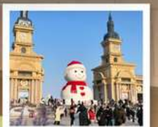
ตึกตาคิยะ-ยักซ์