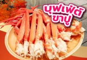
บุฟเฟ่ต์ ซาซู

เช็किनจุดถ่ายรูป ศาลเจ้าฟูจิซัง ฮงกุเซ็นเกินไทยะ