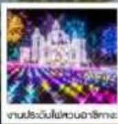
งานประดับไฟสวนอาซากุระ