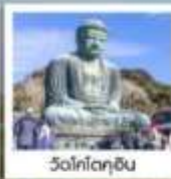
วัดโทคุจิม