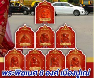
พระพิฆเนศ 8 องค์ เมืองปูณ